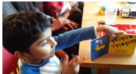
Sinterklaasmiddag in het inloophuis