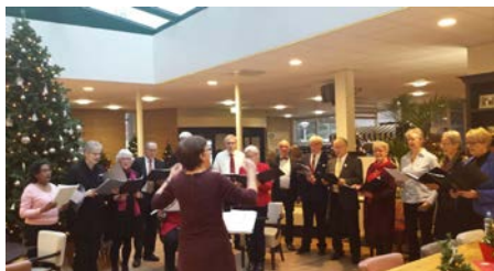
Projectkoor 'heel Schothorst' zingt Kerstmarkt in de Koperhorst

Ook waren er weer activiteiten als 'pilates op de stoel', een laagdrempelige sportieve activiteit voor onze inlopers, een pilot 'yoga op de stoel', het wandelen op de maandag, de vele stille- en bezinningsmomenten en uiteraard de bijzondere activiteiten rondom de feestdagen.